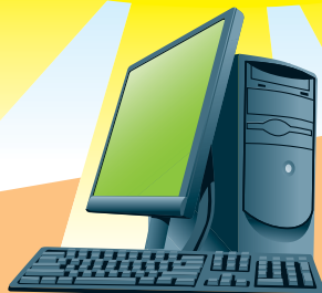
Les appareils électriques et le matériel électronique