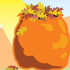
Les sacs de feuilles et de gazon

Pour ces objets : destination éco-centre !